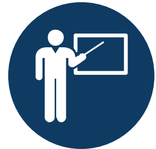
Instrucción y Programa